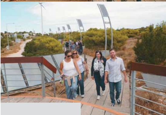
Εκπαιδευτική επίσκεψη στο Πάρκο Ενεργειακής Αγωγής (ΠΕΝΑ) Study visit in the Park of Energy Awareness (PENA)