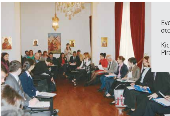
Εναρκτήρια συνάντηση στον Πειραιά Kick Off meeting in Piraeus