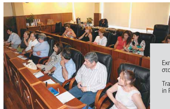
Εκπαίδευση στο Δήμο Πειραιά Training workshop in Piraeus